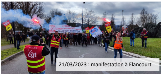
21/03/2023 : manifestation à Elancourt