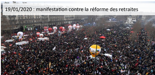
19/01/2020 : manifestation contre la réforme des retraites

La CGT d'ADS a toujours accompagné les mobilisations des salariés qui souhaitent améliorer leurs conditions de vie et de travail (augmentation des salaires, retraite à 60 ans, maintien des services publics, convention collective et RELOAD).