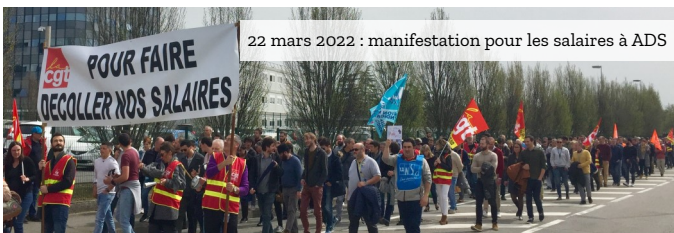
22 mars 2022 : manifestation pour les salaires à ADS