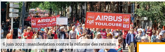
6 juin 2023 : manifestation contre la réforme des retraites

La CGT Airbus D&S a accompagné les mobilisations des salariés qui souhaitent gagner de nouveaux droits et éviter les reculs sociaux :